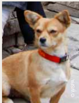
Honden in China gered