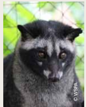
Civetkoffie uit schap